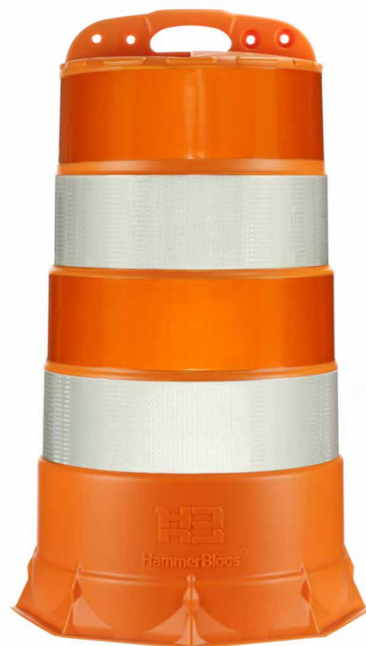
Peso del cilindro: 5.3kg aprox.